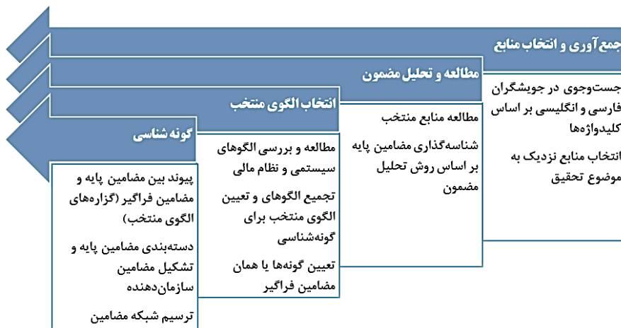
شکل ۱. مراحل و گام‌های فرایند تحقیق

پژوهش حاضر بر اساس نوع هدف، کاربردی - توسعه‌ای است و از منظر روش‌شناسی دارای رویکرد کیفی از نوع تحلیل مضمون است. همچنین در راستای انطباق اصول و ضوابط شناسایی شده از روش گونه‌شناسی استفاده شده است. روش تحلیل مضمون، روش بررسی مفاهیم موجود در متون و داده‌ها تحقیق و استخراج مفاهیم مکون از دل آن‌ها است. با این روش علاوه بر مفاهیم آشکار مفاهیم پنهان نیز جمع‌آوری می‌شود. در روش گونه‌شناسی، با شناخت گونه‌ها و دسته‌بندی داده‌های تحقیق ذیل آن‌ها یک شناخت منسجم، منظم و طبقه‌بندی شده از داده‌ها حاصل می‌شود. در این مرحله تمام منابع به‌دقت مطالعه شده و با روش تحلیل مضمون و با استفاده از نرم‌افزار MAXQDA، شناسه‌گذاری در سطح مضامین پایه انجام گرفته است. مراحل انجام پژوهش در شکل (۱) نشان داده شده است: