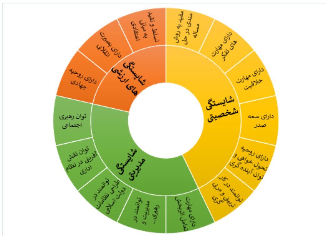
نمودار شماره ۲. شبکه مضامین شایستگی های مدیر طلبه تراز انقلاب اسلامی