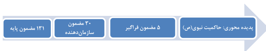
شکل ۳. سیر تطور عبارات‌های علامت‌گذاری شده تا ظهور پدیده «حاکمیت نبوی»

مرحله کدگذاری و شناخت مضامین به تشکیل ۱۳۱ مضمون پایه منجر شد که به ۳۰ مضمون سازمان‌دهنده ارجاع دارند. سپس از تلفیق مضامین سازمان‌دهنده ۳۰ گانه، ۵ مضمون فراگیر (اخوت و یگانگی، یکپارچگی، پاداش الهی، حاکمیت خدا و پیامبر (ص)، و همیاری) پدید آمد که به لحاظ معنایی و ساختاری به ترتیب با وجوه ۵ گانه حاکمیت شامل پایه مناسبات، میزان وابستگی، واسطه مبادله، وسیله حل تعارض و هماهنگی، و فرهنگ همخوانی دارند. این فرایند چند مرحله‌ای تحلیل داده‌ها از عبارات‌های مندرج در متن تا ظهور پدیده محوری «حاکمیت نبوی» در شکل شماره ۳ نشان داده شده است.