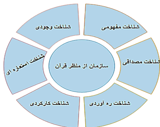
شکل شماره ۱: انواع شناخت سازمان