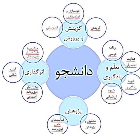
نمودار ۲. شبکه مضامین نظام مسائل کلان دانشجو در نظام حکمرانی دانشگاهی اسلامی