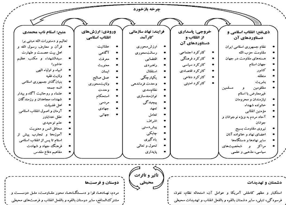
شکل ۱. الگوی سیستمی ویژگی‌های زمینه‌ای نهادهای انقلاب اسلامی

پویایی‌شناسی سیستم‌ها، دیدگاه و مجموعه‌ای از ابزارهای مفهومی به منظور درک ساختار و پویایی سیستم‌های پیچیده است (استرمن، ۲۰۰۰؛ ترجمه برارپور و همکاران، ۱۳۸۸: ۷). مدل‌سازان پویایی‌شناسی می‌کوشند مسئله را به صورت الگویی رفتاری در طول زمان نشان دهند (همان: ۱۵۱). مدل‌سازی یک مسئله و نه یک سیستم، استفاده از روش‌های و ابزارهای مکمل، آزمایش و اصلاح مداوم مدل، درک بازخوردها و پرهیز از جزئیات بسیار زیاد، از جمله اصول توسعه مدل‌های پویایی‌شناسی است (همان: ۱۳۸-۱۴۰).