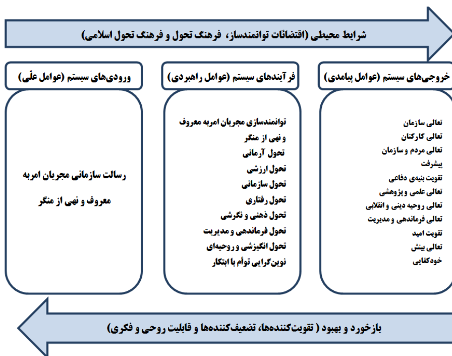
شکل ۳. مقوله های شش گانه تحقیق در چارچوب الگوی پارادایمی

فرآیند توانمندسازی مجریان امر به معروف و نهی از منکر در این تحقیق به عنوان یک فرآیند سیستمی مشتمل بر پنج مرحله به شرح نمودار زیر می باشد.