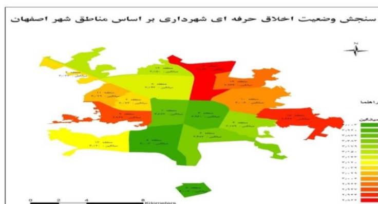
شکل ۱. میانگین اخلاق حرفه‌ای شهرداری بر حسب مناطق شهر اصفهان

باتوجه به میانگین‌های به‌دست آمده در جدول ۸، که در بازه (۳,۶۶ - ۲,۳۴) قرار می‌گیرد، میانگین اخلاق حرفه‌ای تمامی مناطق شهرداری شهر اصفهان بجز منطقه ۱، ۳، ۵ در سطح متوسط قرار دارد؛ به‌عبارتی میانگین اخلاق حرفه‌ای مناطق ۱، ۳ و ۵ شهرداری شهر اصفهان به‌دلیل قرارگرفتن میانگین‌ها در بازه (۳,۶۷ - ۵)، در سطح قوی قرار دارد. طبق نتایج بیشترین میانگین مرتبط با شهرداری منطقه ۵ (۴,۰۰) و کمترین میانگین مرتبط با شهرداری منطقه ۷ (۲,۸۶) است.