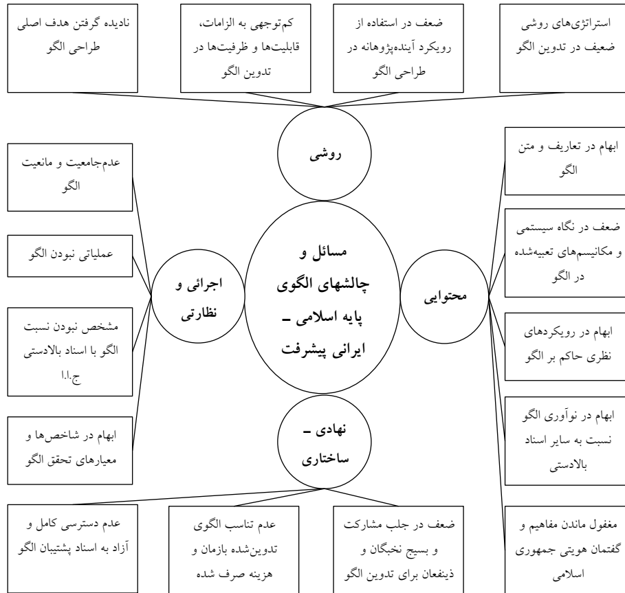
نمودار ۱: شبکه مضامین مسائل و چالشهای الگوی پایه اسلامی ایرانی پیشرفت

یافته‌های پژوهش حاکی از آن است که مسائل و چالش‌های الگوی پایه اسلامی ایرانی پیشرفت را می‌توان در سطوح چهارگانه محتوایی، نهادی - ساختاری، روشی، و اجرایی و نظارتی دسته‌بندی نمود.