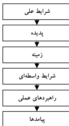
شکل ۲: الگوی کدگذاری (استراس و کوربین، ۱۳۸۵)

در این فرایند «شرایط علی»، وقایعی است که باعث ایجاد «پدیده» می‌شود. «زمینه» محیط ویژه‌ای است که تحت شرایط علی و «شرایط واسطه‌ای» پدیده از آن به دست می‌آید. «راهبردهای عملی»، مجموعه اقداماتی است که در جهت وقوع و بروز پدیده انتخاب می‌شود و «پیامدها» هم